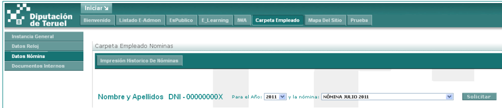
Acceso a los recibos de nóminas