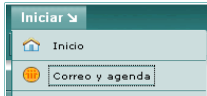
Acceso al correo del usuario