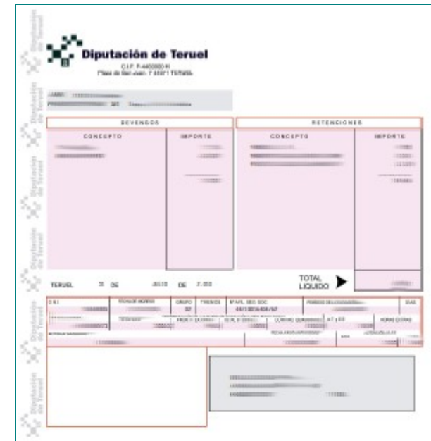
Recibo de nóminas de DPT