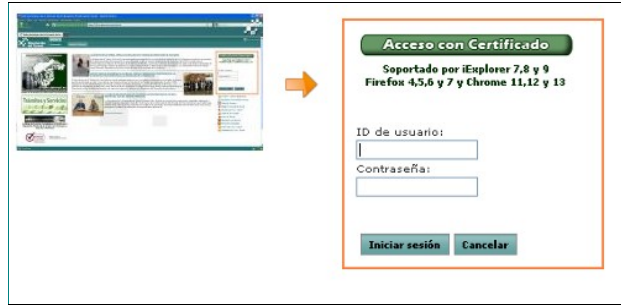
Acceso a la Sede Electrónica de DPT

En primer lugar, el empleado debe identificarse como usuario en la Sede Electrónica de la Excma. Diputación Provincial de Teruel con cualquiera de los siguientes métodos: