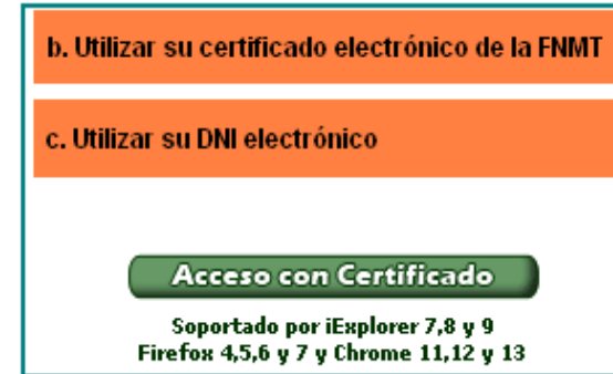
Acceso a la Sede Electrónica con certificado